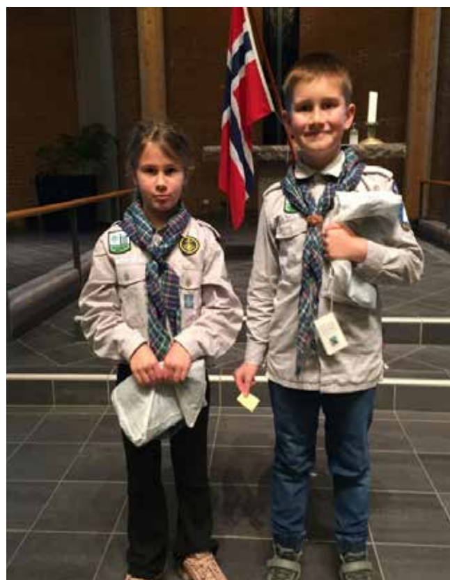
Vinnere på inngangsbillett