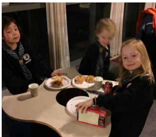
Det smakte godt med kaker