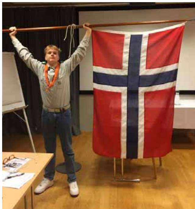
Avslutning med Flagg innrulling og speiderbønn.