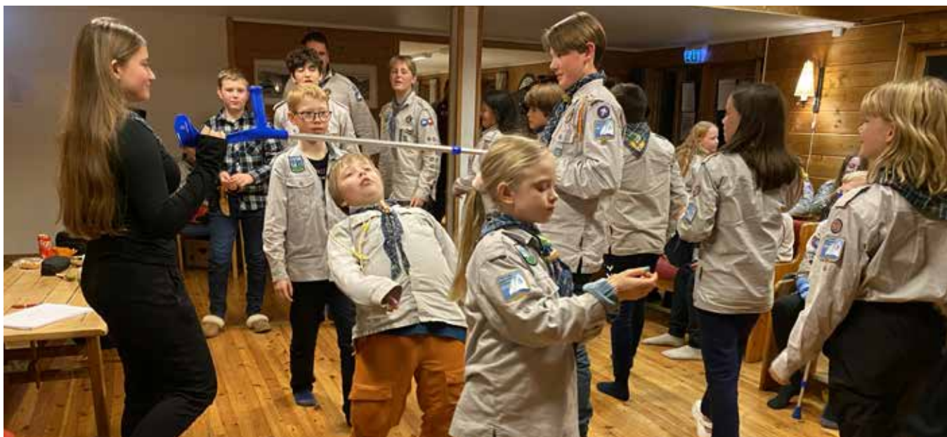
Orden på rommene, her er det noe å lære for de eldste vandrerne, og spesielt guttene ...