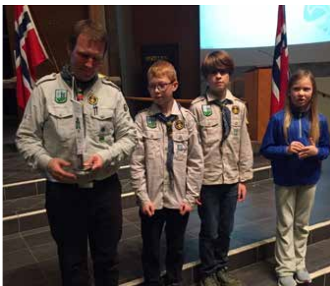
5 års vimpel