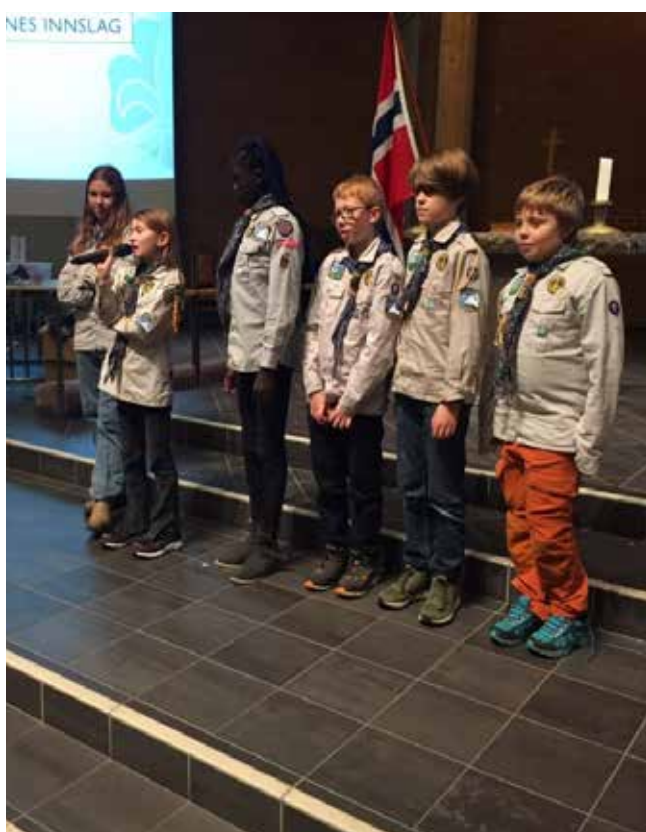
Tirsdag småspeider har opptinn