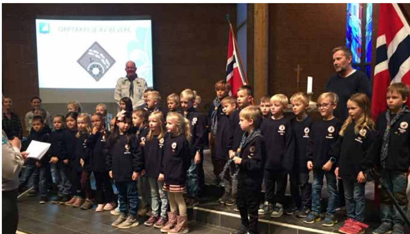
Beverne blir tatt opp