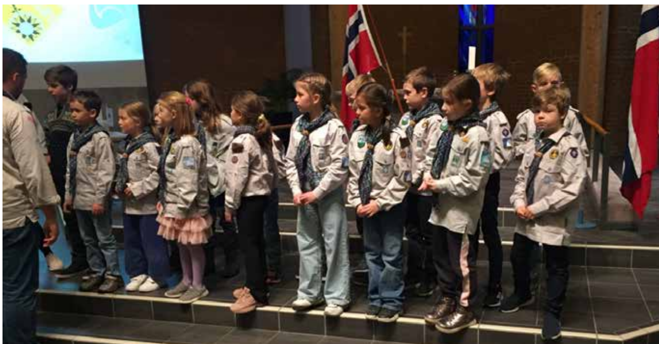
Opptagelse av tirsdag småspeider