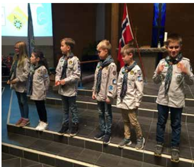
Opptagelse av torsdag småspeider