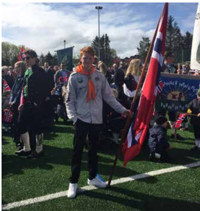
Endre gikk i flaggborg

talen. Etterpå var det sang og en mengde som skulle ha premier.